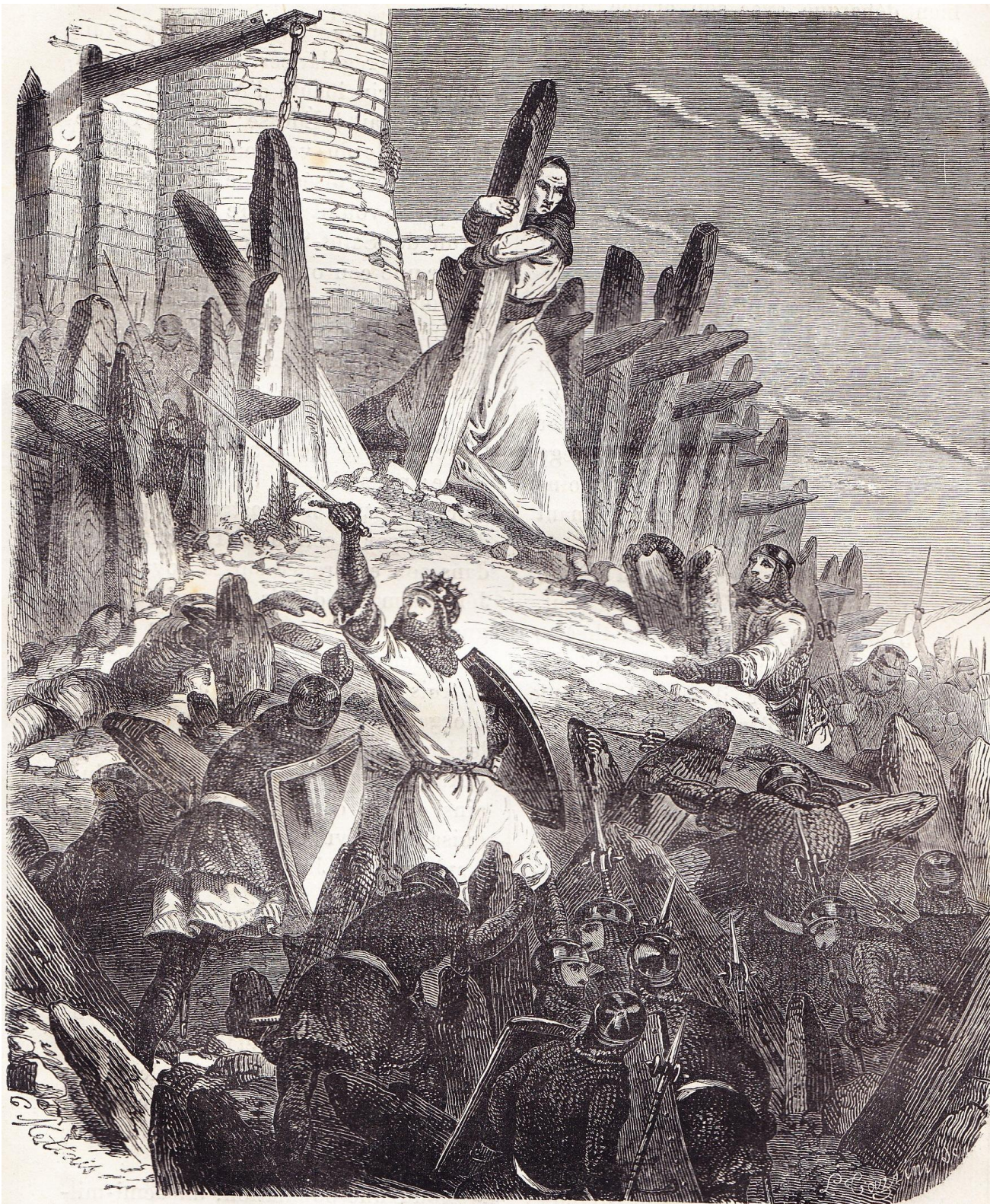
Prise du château du sire Hugues du Puiset par Louis le Gros.